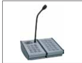
Dijital Anons Ünitesi DCS15, DKM18 ile birlikte